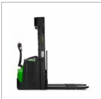
CESAB S215-220, S215L-220L