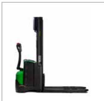
CESAB S210-214, S208L-214L, S220D